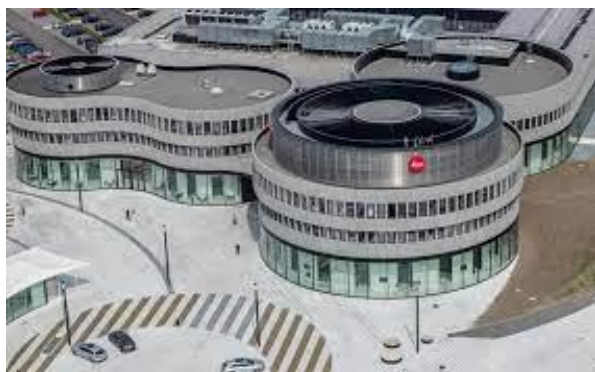
Leica fabriek en museum (world) in Wetzlar

Het programma zal dan in overleg met de IPA Wetzlar & Gießen worden voorbereid.